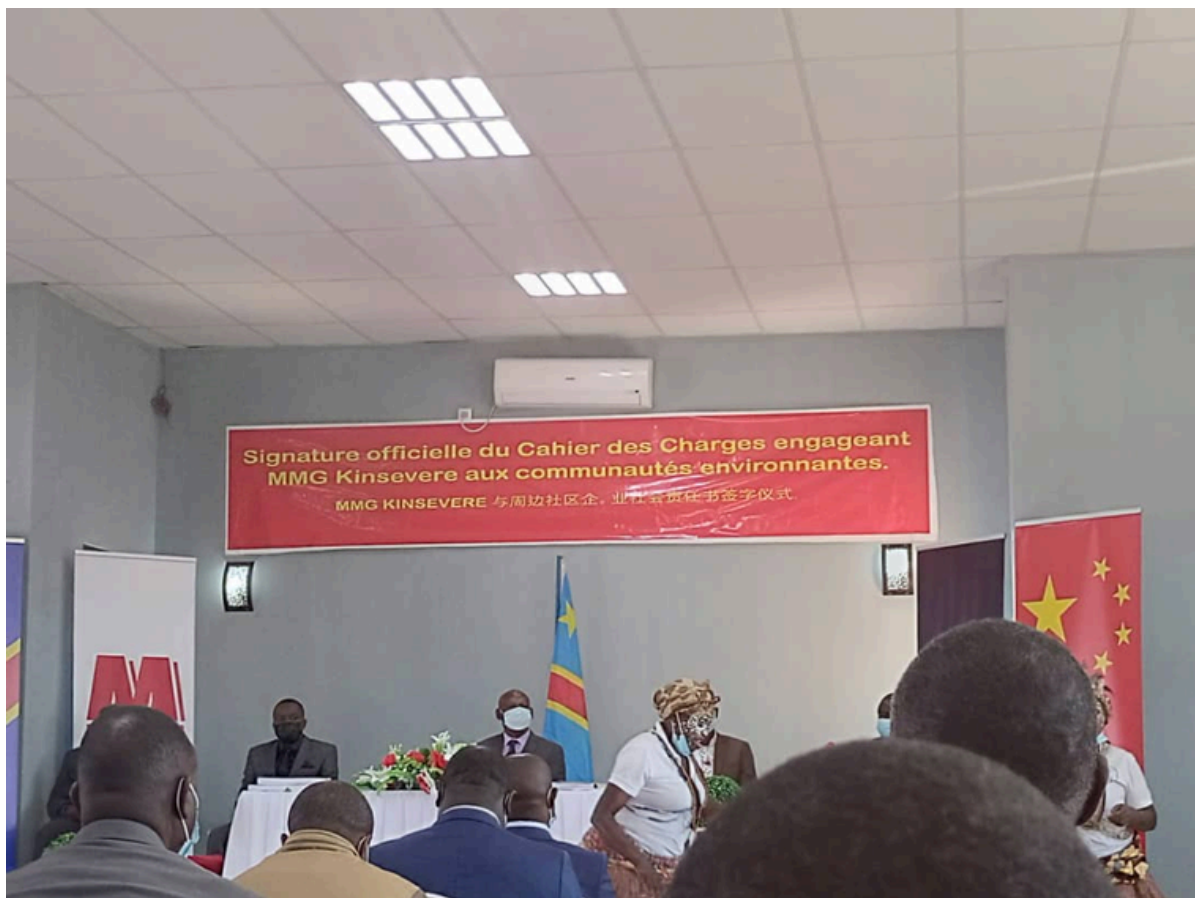
@ Cérémonie de signature du Cahier des Charges engageant l'entreprise MMG Kinsevere vis à vis des communautés locales

Par ailleurs, la faible mise en cohérence des projets du cahiers des charges et ceux d'autres leviers de développement communautaire (redevance minière, cahier des charges et dotation minimale de 0,3% du chiffre d'affaires) et des programmes de développement du gouvernement central est un autre facteur qui contribue négativement à la réalisation des projets pertinents et durables.