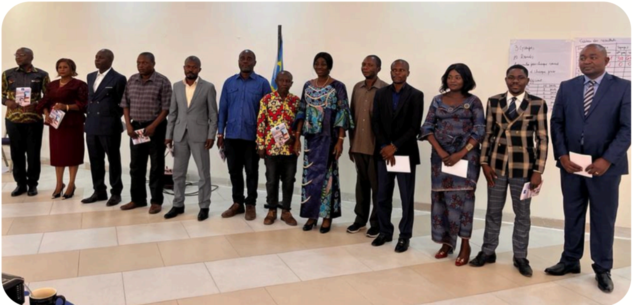
@Installation & Mise à niveau des membres de la Commission Permanente d'Instruction des Cahiers des charges de la Province du Tanganyika, Kalemie -Août 2023

Quoique beaucoup de cahiers des charges transmis aux Gouverneurs de province aient été approuvés d'office tel que décrit ci-dessus, certaines entreprises minières trainent le pied pour amorcer le processus d'exécution des projets sociaux, préférant recevoir préalablement l'arrêté d'approbation et l'attestation du cadastre minier confirmant le respect de l'obligation de négocier et de signer le cahier des charges.