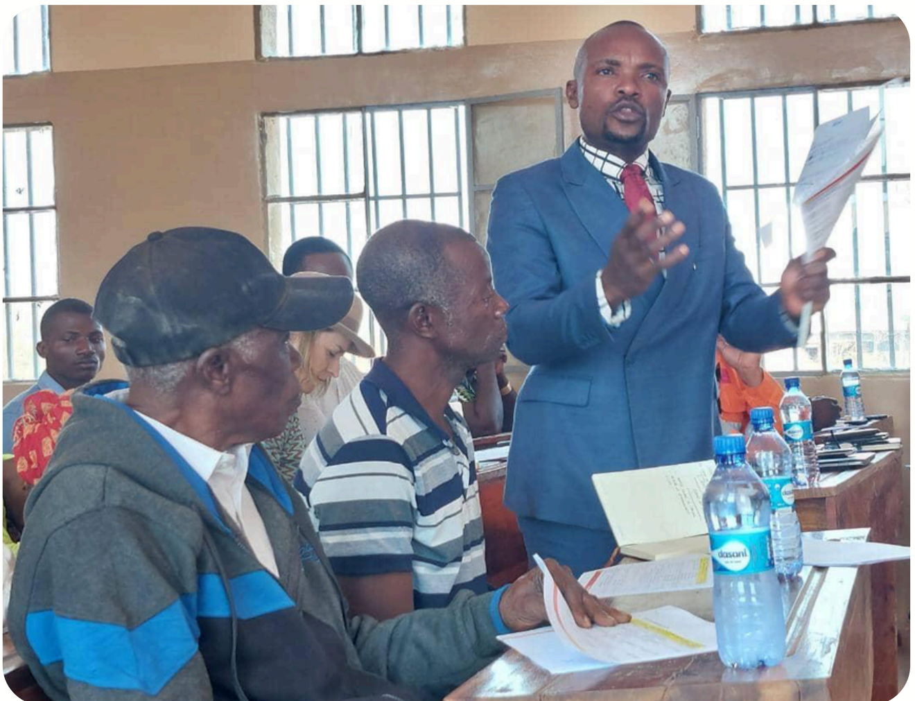
@Un membre du CLD/Secteur de Bukanda prend la parole lors des négociations du cahier des charges

Les estimations faites sur base d'un échantillon de dix (10) cahiers des charges signés et approuvés que l'équipe du Centre Carter a pu examiner montrent que le budget du cahier des charges signés pour cinq (5) ans est financé en moyenne par 1% du chiffre d'affaires d'une seule année de chacune de ces entreprises minières. Ceci signifie budget annuel de ces cahiers des charges est d'environ 0,2% des chiffres d'affaires de ces entreprises minières. Ces estimations reflètent la tendance globale de la modicité des budgets des cahiers des charges signés entre 2018 et 2024.